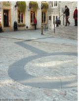
1-4 Traces de la seconde habitation de Champlain