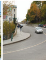
4-3 Côte de la Montagne