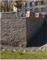
2-5 Batterie Royale