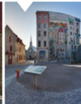
4-1 Parc de la Cetière

Point de départ de la vision panoramique