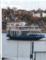
2-4 Traverse Québec-Lévis