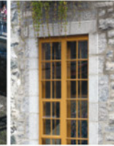
4-6 Pierre calcaire et le grès