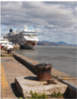
2-3 Fleuve Saint-Laurent