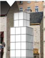
2-1 Place de Paris

Point de départ de la vision panoramique