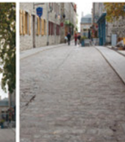
5-3 Écoulement des eaux usées