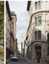
5-4 Rue Saint-Pierre, côté nord