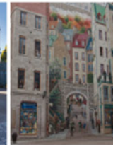
4-2 Fresque des Québécois