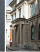
5-8 Banque de Québec