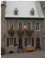
1-2 Maison Fornel