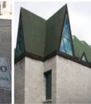
5-6 Musée de la civilisation