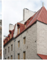
3-5 Mur en «cul-de-poule»