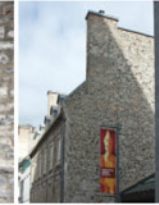
5-7 Maison Estèbe