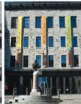
1-6 Centre d'interprétation de Place-Royale