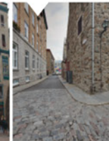
5-1 Quartier de transition

Point de départ de la vision panoramique