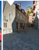
3-1 Rue du Cul-de-Sac

Point de départ de la vision panoramique