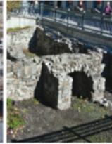
4-5 Vestiges de la maison Guillaume-Gaillard