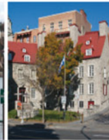
3-3 Maison Chevalier