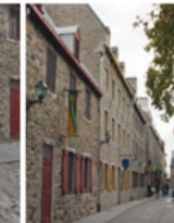
5-2 Rue Saint-Pierre, côté sud