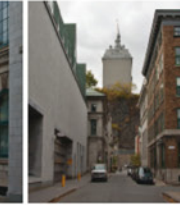
5-9 Rue de la Barricade