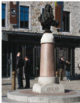
1-5 Buste de Louis XIV