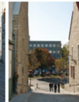
3-2 Anse du Cul-de-Sac