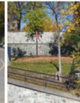
4-4 Premier cimetière de Québec