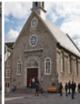
1-3 Église Notre-Dame-des-Victoires