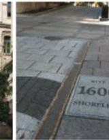
5-5 Expansion des berges