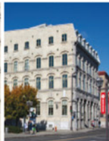
2-2 Entrepôt Thibaudeau