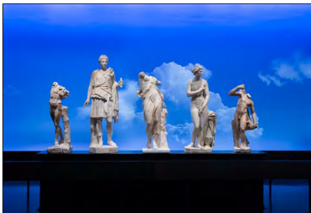
L'exposition Les maîtres de l'Olympe. Trésors des collections gréco-romaines de Berlin

La Fondation a remis à l'institution muséale pour l'exercice 2014-2015 un montant de 745 137 $ 1 , Cette somme contribuera à la mise en œuvre de projets rivalisant d'audace et d'originalité, et ce, pour le grand plaisir des visiteurs :